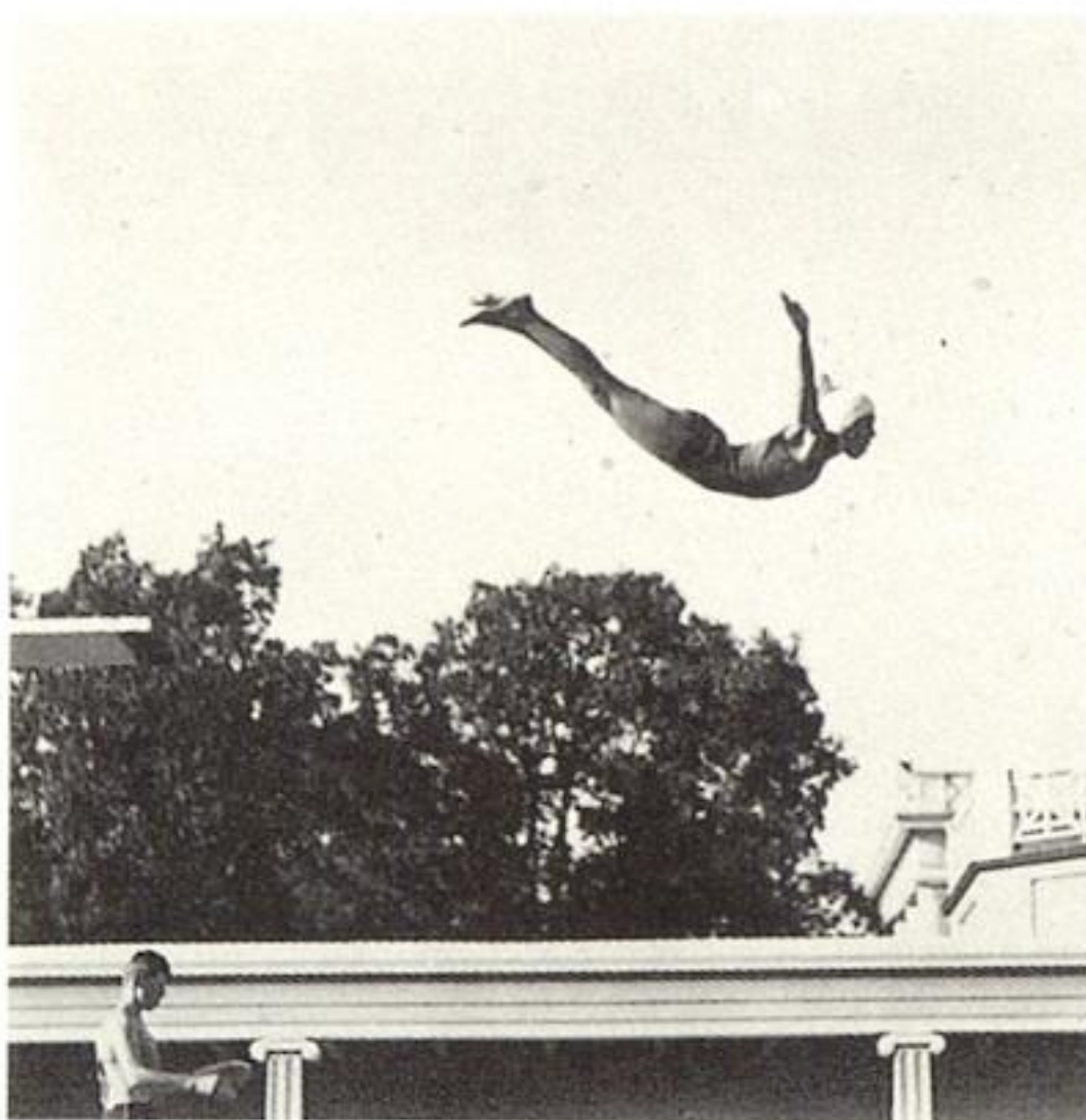
Plongeon de Joan Mitchell, vers 1935.

Je n'oublierais jamais à quelle point elle m'a nourrie et aidée à me construire, je n'oublierais pas non plus sa disponibilité, sa générosité et son talent.